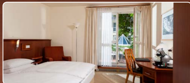
Superior Zimmer 27 m 2 / max. 2 Personen

Bei Verkürzung der Aufenthaltsdauer nach Anreise, wird dem Gast jeweils eine zusätzliche Nacht zum vollen Preis in Rechnung gestellt. Anreisen ohne Anmeldung können nicht zum Schachtarif gewährt werden.