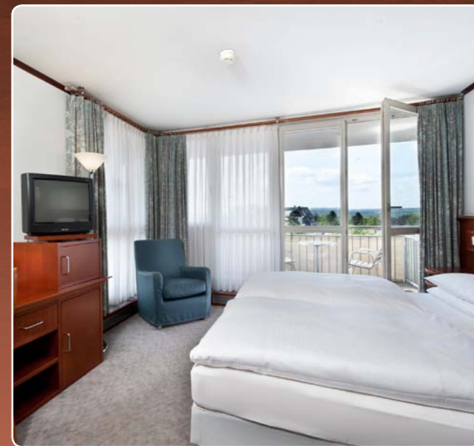
Standard Zimmer 24 m 2 / max. 2 Personen